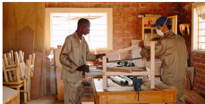
Gemüseanbau, Computerschule, Tischlerei