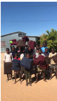
Warme Decken kommen in den Einrichtungen dankend an