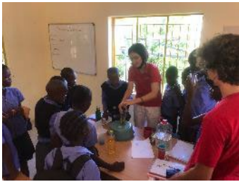
Die ersten Volontär*innen kommen von Januar bis Juli endlich wieder nach Okakarara!

Neue Büchereien oder Büchersätze in allen Projekten