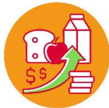
Dramatischer Preisanstieg bei Lebensmitteln und Energie!