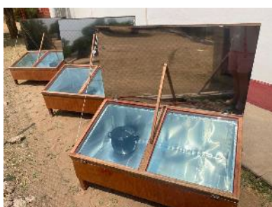
Solaröfen für Okakarara zum Energiesparen